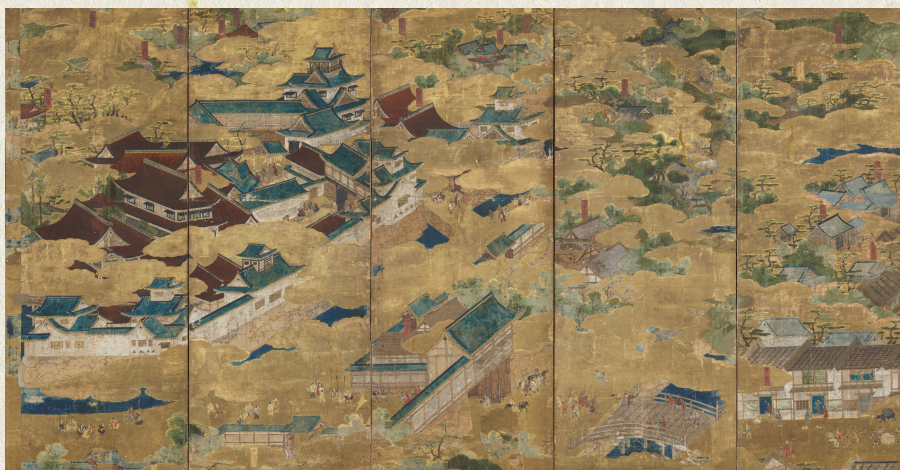
聚楽第図屏風(部分) 桃山時代 16世紀 東京・三井記念美術館蔵【後期】

2026年の大河ドラマ「豊臣兄弟!」は、「彼が長生きしていれば豊臣家の天下は安泰だった」とまで言わしめた豊臣秀長の目線で、戦国時代をダイナミックに描く物語です。本展覧会ではドラマと連動し、豊臣秀長と兄・秀吉、彼らをとりにまく織田信長、徳川家康、黒田官兵衛、藤堂高虎、千利休、高台院らゆかりの品々をはじめ貴重な歴史資料を紹介。兄弟の生き様、二人が駆け抜けた時代を浮き彫りにします。